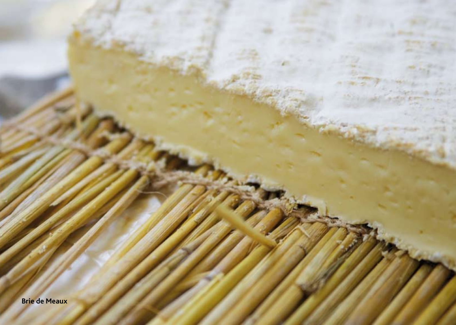
Brie de Meaux